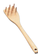
⑮竹製 うどんすくい