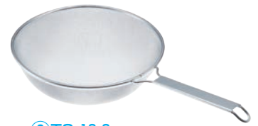
③TS 18-8 楽しくそばすくい網 35cm