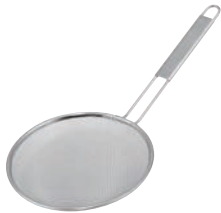
⑦TS 18-8 背油こし

「握りやすく」「滑りにくい」仕上り 麺の水切りはもちろんラーメンに入れる豚の背油切りにもご使用できます。