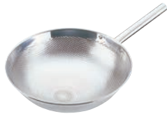
①UK 18-8 パンチング スライザ