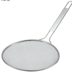
④TS 18-8 共柄すくい網 30cm