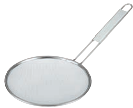
⑧TS 18-8 ラーメンスープこし